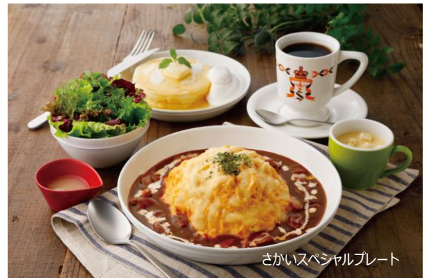
さかいスペシャルプレート