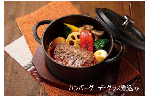
ハンバーグ デミグラス煮込み