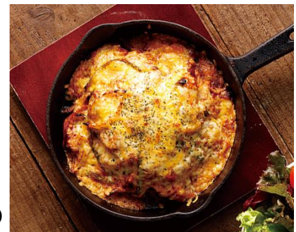
チーズミートソーススパゲティ 1,180円(税込)

北海道の「さかい珈琲」では帯広のソウルフードである「チーズミートソーススパゲティ」をランドメニューに入れています。さらに、帯広での営業が充実していくことから、食材の宝庫、地元“十勝”の産品を活用したメニューを検討して、地元のお客から一層愛される“本格派カフェ”にしていきます。