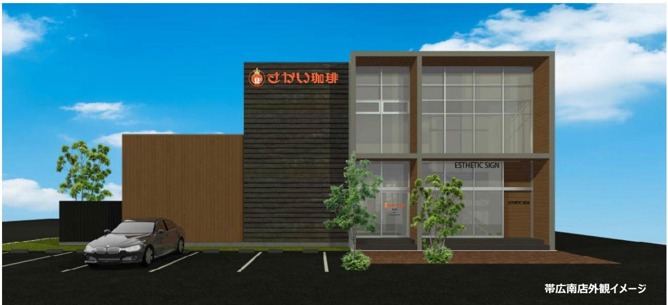
帯広南店外観イメージ

「さかい珈琲」は“本格派カフェの全国チェーン”。パンケーキ、フードメニュー、ドリンクのクオリティが高く品揃えが充実していて、モーニング、ランチ、ティータイム、ディナーと全時間帯で利用を楽しむことができます。6月2日に北海道帯広市内に2号店目（北海道3号店）となる「帯広南店」がオープン。女性店長、社員による女性目線の充実したおもてなしが注目されます。