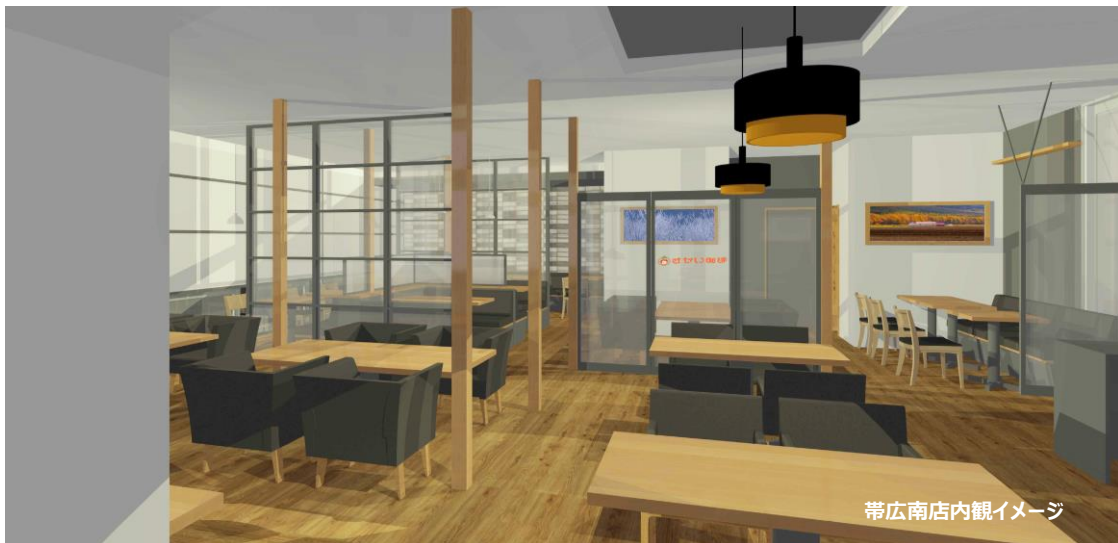
帯広南店内観イメージ

「さかい珈琲」帯広店と帯広南店の間は約3km。帯広店はレンガ造りで大正時代の建造物を活用。それに対して帯広南店は今日的なライトなデザイン。名物のメニューは両店ともにラインアップするが、帯広南店は若者、ファミリーをターゲットにしたメニューを豊富に構成。それぞれの利用目的が異なるようにして、二つの「さかい珈琲」によって、「さかい珈琲」全体の魅力を堪能できるように考慮しています。