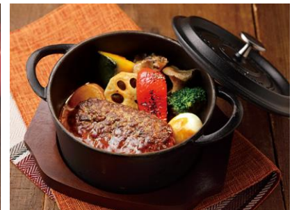
ハンバーグデミグラス煮込み 1,380円(税込)