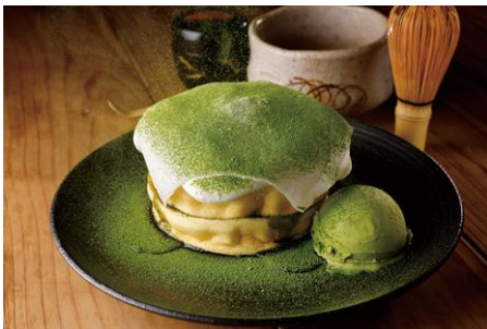
西尾の抹茶パンケーキ 1,320円(税込)

「さかい珈琲」のメニューの特徴は、食事でも休憩でもすべての時間帯が満たされていること。フードメニューではさかい珈琲創業当時の看板メニューである「鉄板ナポリタン」や「ココット料理」などを提供し、スイーツ&デザートでは「パンケーキ」が充実させている。