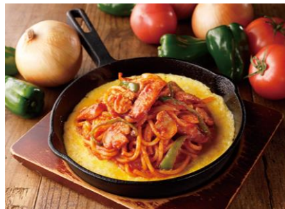
鉄板ナポリタン 1,080円(税込)