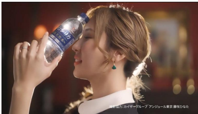
撮影協力:カイザーグループ アンジュール東京 藤咲ひなた

※2026年2月期_六本木エリアのキャバクラにおける市場調査 調査機関：日本マーケティングリサーチ機構