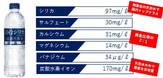
「のむシリカ」に含まれる主な栄養成分

鹿児島県と宮崎県をまたぐ、大自然の残る霧島連山で生まれた天然水「のむシリカ」。様々な世代に支持され、累計販売本数が1億本を突破しました。(2017年4月12日～2023年7月31日 Qvou 調べ)シリカは、コラーゲンやヒアルロン酸などの美容成分にも密接に関わりがありますが、日々体内で消費されるため、健康と美容のためには毎日取り入れることが大切です。また、軟水と硬水の間にあたる「中硬水」のため、ミネラル豊富なのに飲み口まろやか。さらに安心してお召し上がりいただけるよう、毎月 PFAS の検査もおこなっています。