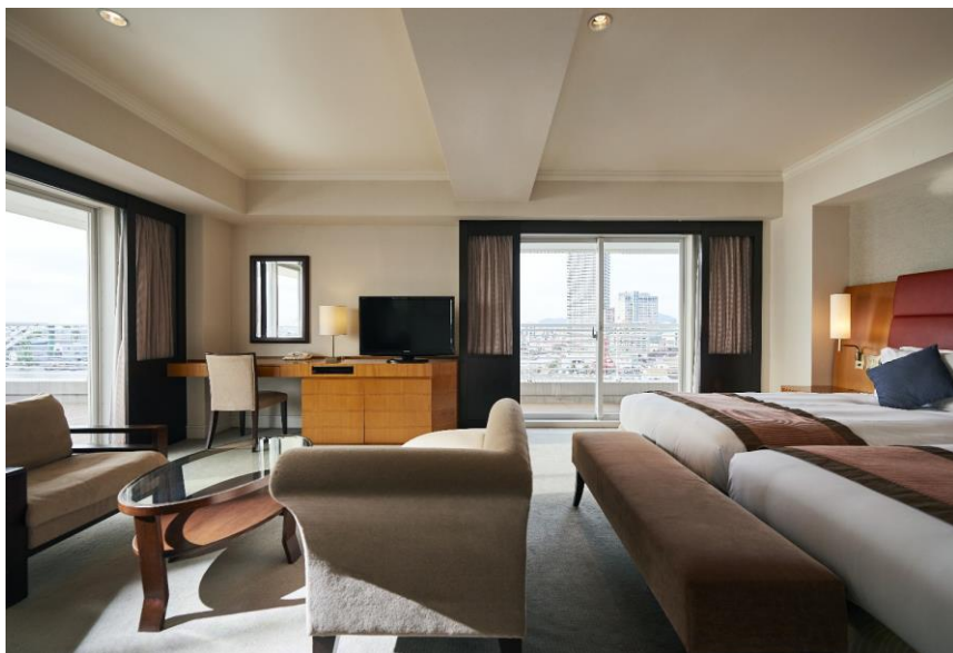
▲デラックスコーナーツイン

「エグゼクティブルーム」へご宿泊のお客様は、エグゼクティブラウンジでの朝食はもちろん、プライベートバルコニーでお召し上がりいただけるルームサービス朝食や、人気buffetレストラン「サンタモニカの風」での朝食または昼食への変更も可能です。また、スムーズにお手続きいただける専用カウンターでのパーソナルチェックインサービスやレイトチェックアウトサービス、まるで豪華客船内に設けられたような広大な海を望むケーションのプール・ジムのご利用、神戸港のクルージング体験のご優待、館内レストラン・ショップでの10%off ご優待など、様々な特典をご利用いただけ、客船での船旅のようでありながら快適な滞在が楽しめます。