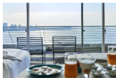
▲ルームサービスイメージ