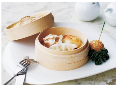
▲アフタヌーンティー