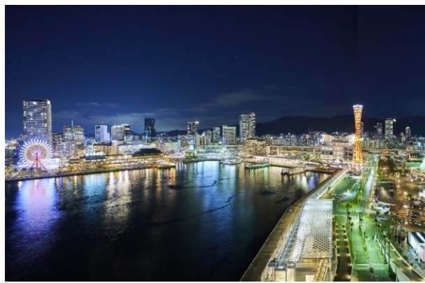
▲VIEW BAR テラス席からの夜景