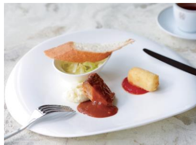
▲イブニングカクテル