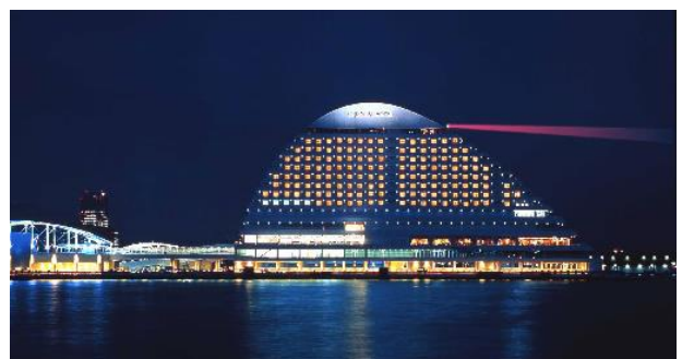
▲灯台夜間イメージ

◎新型コロナウイルスの影響により、公開中止となる場合がございます。 なお、最新情報につきましては随時ホテル公式サイトよりご案内いたします。