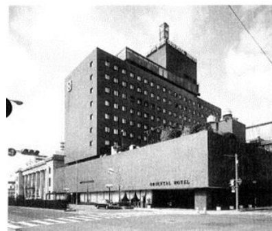
▲旧オリエンタルホテル

オリエンタルホテルは何度も移転を繰り返し、1964年（昭和39年）には京町25番地へ移転。その際、第5代社長に就任していた日本郵船の安部正夫氏が、“港街・神戸のシンボルに”という想いのもと、日本で初めてホテルの敷地内に建つ公式灯台が設置されました。1995年（平成7年）1月17日に阪神淡路大震災が発生し、ホテルは全壊、営業停止となりました。