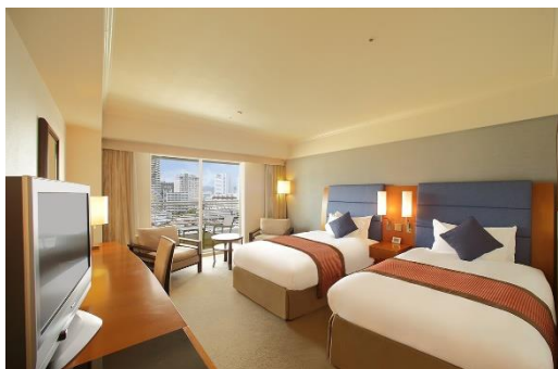
「スタンダードツイン」客室イメージ