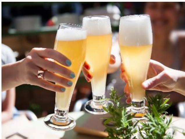
「サンタモニカの風」ビアテラスイメージ

神戸港が一望できるテラス席で心地よい潮風を感じながら、多彩な和洋中のbuffetメニューや、生ビール、ワイン、カクテル、ソフトドリンクなど約30種類のドリンクメニューがお楽しみいただけます。6月30日(金)までは、オリエンタルホテルズ&リゾーツのグループホテル共通フェア「Buono (ブオーノ)！陽気なイタリアンフェア」も開催中のため、イタリアの定番料理から家庭料理までシェフのこだわりが詰まった限定メニューや、世界販売数1位のプレミアムイタリアンビール「ペローニナストロアズーロ」も追加料金なしでお召し上がりいただけます。また追加オプションとして、神戸大橋やメリケンパークを望む東側の景色を眺めながら、ソファ席でゆったりと食事を満喫できる「イーストラウンジェリア」、お肉または魚介をBBQで楽しめる2種類のBBQプレートもご用意。目の前に海を望む、開放的なロケーションで贅沢な時間をお過ごしいただけます。ビアテラス付の宿泊プランも、2023年3月15日(水)より予約受付を開始いたします。