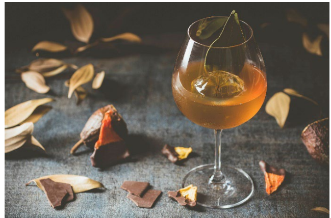
（Cacao Pairing Cocktail イメージ）