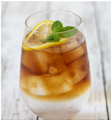
ダーズリンセパレートティー