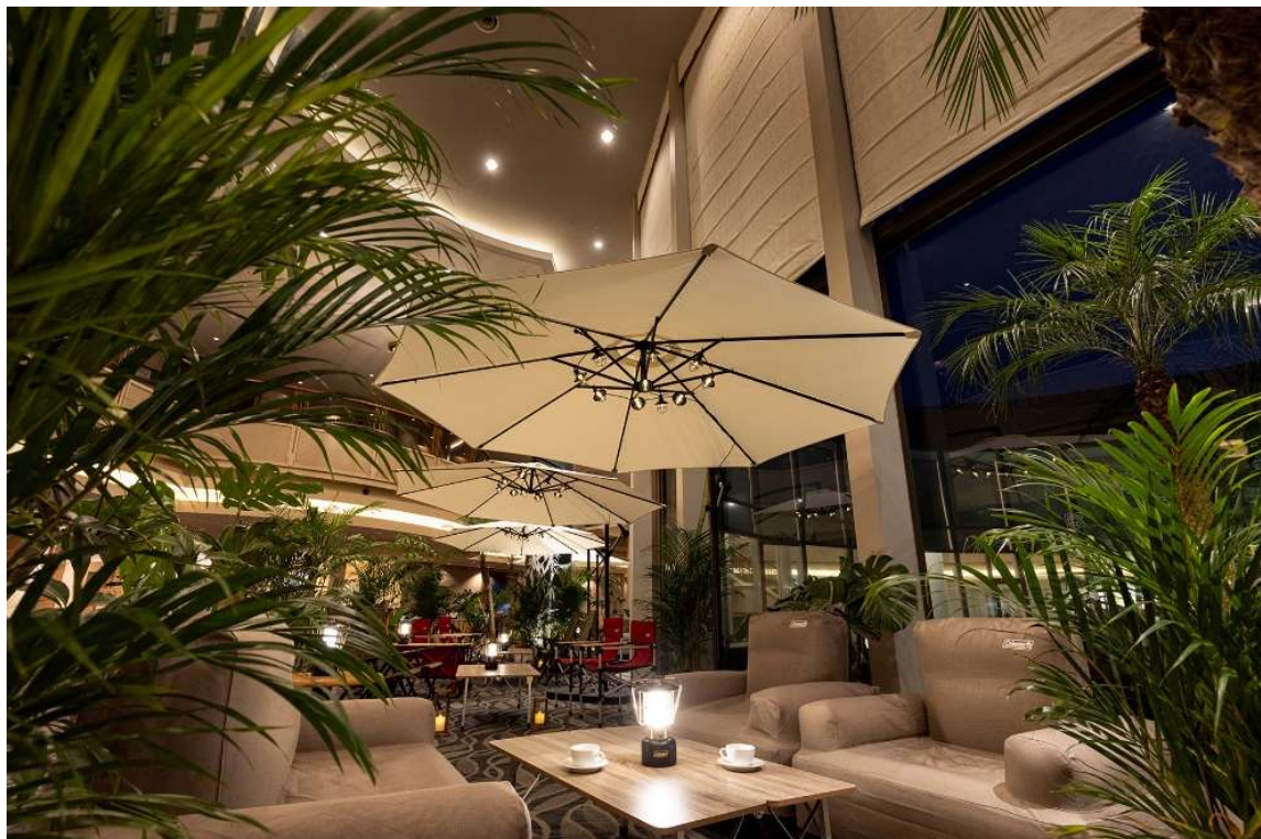
夜はランタンの灯りで日中とは違う空間にいるようなほっとする穏やかさを味わうヒーリングタイムを。