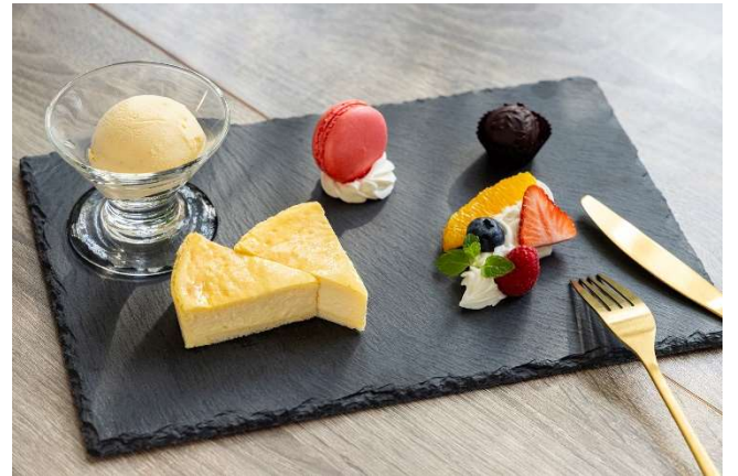
チーズケーキのデザートプレート