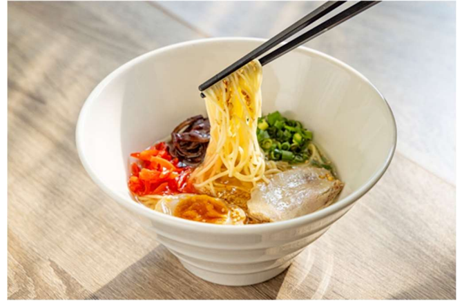
ハーフサイズのとんこつラーメン