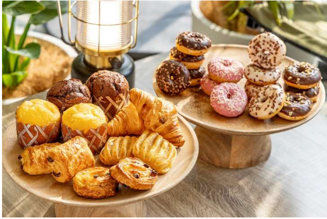
ペーカーズ セレクト お好み 3 種をお選びいただけます