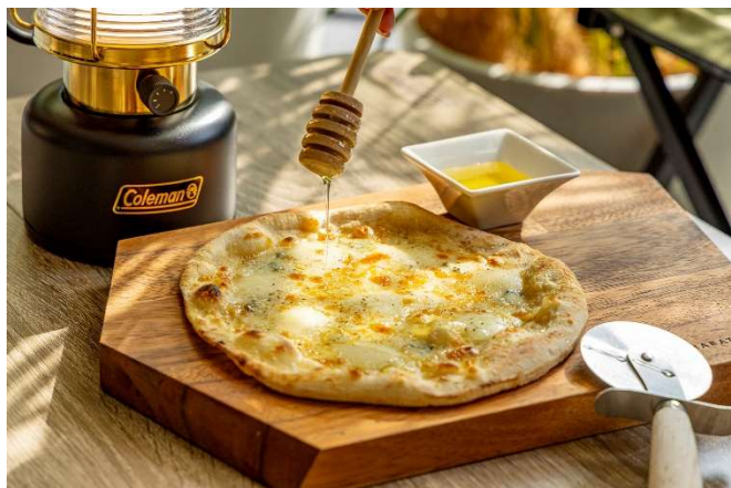
クワトロフォルマッジ