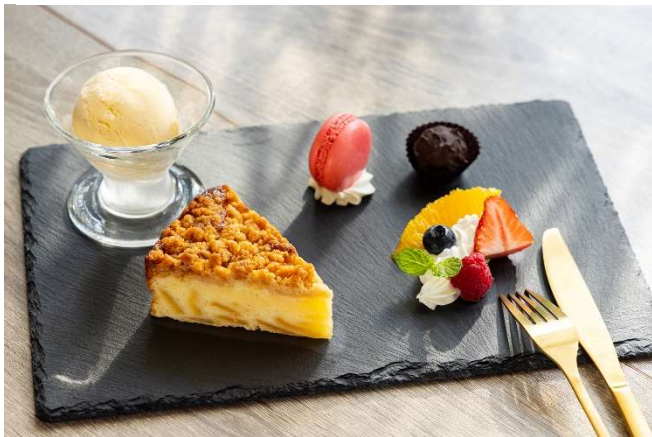
アップルクランブルのデザートプレート