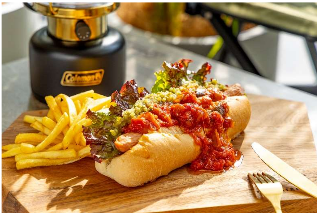
(左)「野菜とトマトのドッグ」 (左下)「プレーンドッグ」 (右下)「チリビーンズドッグ」

「Coleman Café with Terrace Restaurant」の看板メニューである、ホットドッグには2種のウィンナーを使用しています。桜チップで燻した肉感を感じることができるあらびきウィンナーをサンドした「野菜とトマトのドッグ」。天然の羊腸を使用しており、パリッとした食感と歯ざわりの良いことが特長です。「チリビーンズドッグ」にはダイスカットしたチーズ入りチョリソーをサンドしています。スパイシーなチリビーンズとチョリソーの組み合わせは激辛好きの方向けに。ほかに「プレーンドッグ」もご用意しています。パンはフランスパン生地です。外はサクッと、中はもっちりとした軽い食感。歯ごたえあるウィンナーをサンドしたこだわりのホットドッグを3種ご用意しました。