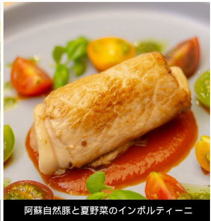
阿蘇自然豚と夏野菜のインボルティーニ