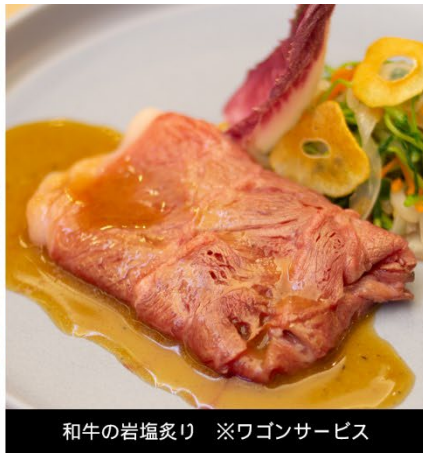
和牛の岩塩炙り ※ワゴンサービス