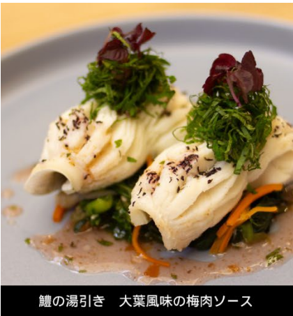
鱧の湯引き 大葉風味の梅肉ソース