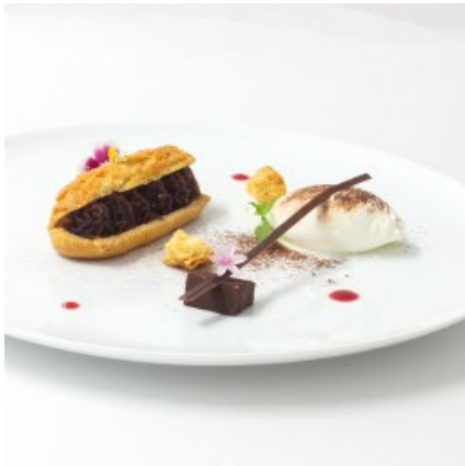
「あんことエクレア」のアシェットデセール

のフルーツを使った「桃のコンポート」、コーヒーと相性の良い「あんことエクレア」のアシェットデセールをセレクト。高品質のモカコーヒーができるエリアで有名なエチオピア南部にあるシダモ県。そのエリアでも【別格】扱いされているイルガチェフェの紅茶やブランデーを想わせる芳醇で濃厚なフローラルアロマと、花蜜を感じさせる爽やかな酸味と甘み、味の切れ。そのレベルの高さを本研究所でご体感ください。