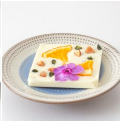
ホワイトチョコレートパレット