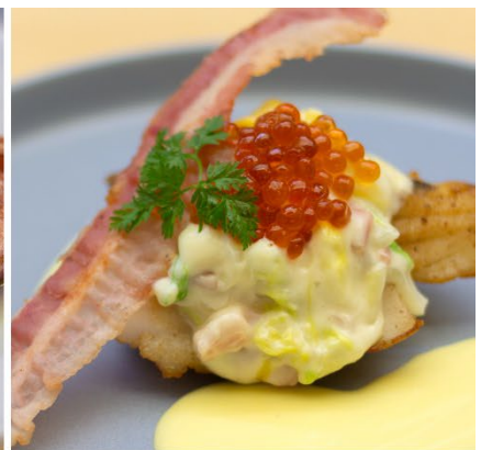
北海道産真鱈のポワレ イクラを添えて