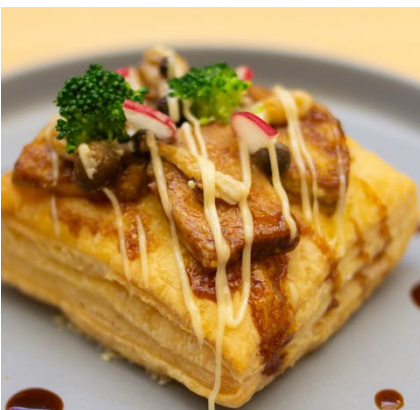
糸島雷山ポークとフォアグラのトリュフパイ