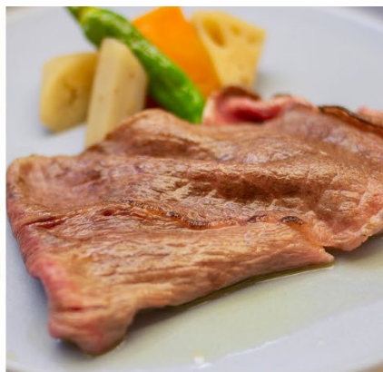
九州産A4黒毛和牛ロースの岩塩炙り