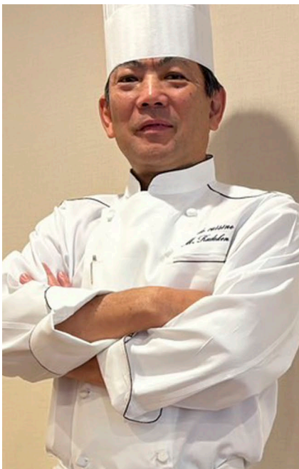
沖縄ハーバービューホテル 久手堅総料理長

今回のコラボレーションでは、3ホテルの総料理長・統括料理長が自信を持っておすすめする代表的なメニューを、それぞれのホテルの店舗で再現。オリエンタルホテル福岡博多ステーション「Cafe & Bar CROSS POINT（クロスポイント）」、沖縄ハーバービューホテル「ロビーラウンジ」、オリエンタルホテル沖縄リゾート&スパ「ロビーラウンジ」の3店舗で3種の料理とスイーツを期間限定で同時提供いたします。