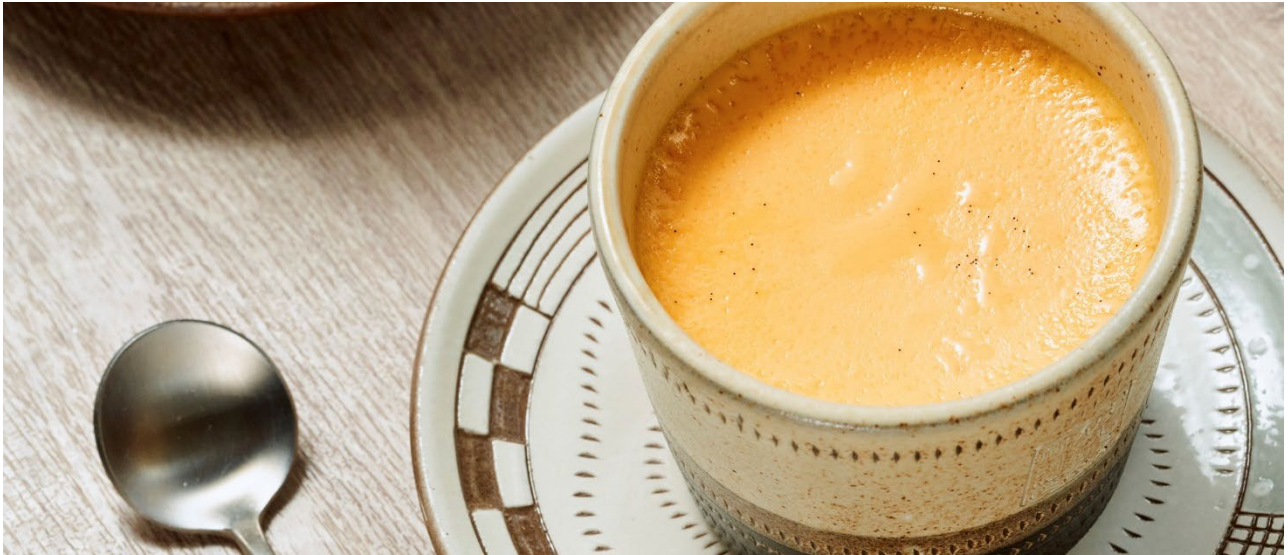
オリエンタルホテル福岡博多ステーション「オリエンタル博多プリン」