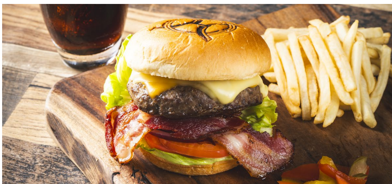
オリエンタルホテル沖縄リゾート&スパ「オリエンタルバーガー」