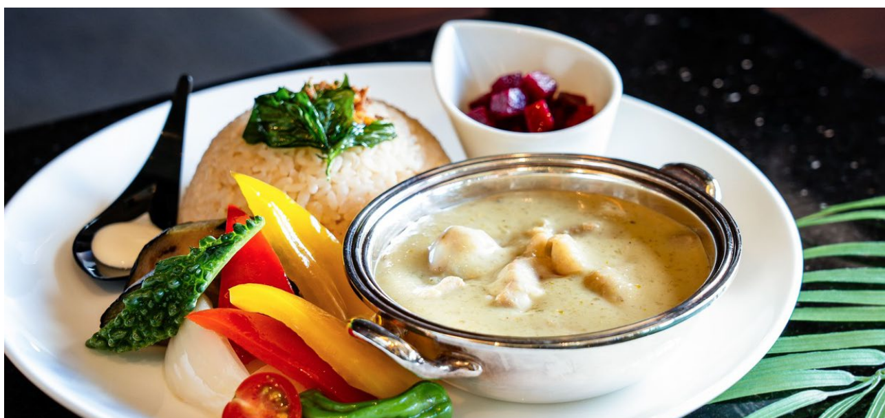
沖縄ハーバービューホテル「グリーンカレー」

オリエンタルホテルズ&リゾートの福岡と沖縄地域を代表する3施設の人気メニューを一堂に楽しめるこの機会をお見逃しなくご来場ください。