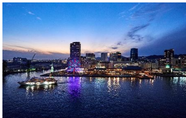
▲コンフォートツインウエストビュー客室イメージ、ウエストビューイメージ

「KOBE SEASIDE BEER TERRACE」オンライン予約・宿泊プランの詳細はこちら