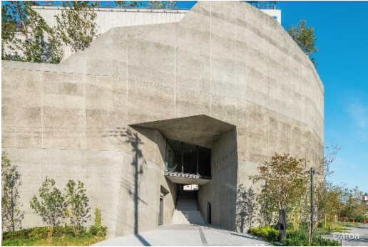
AQUARIUM×ART átoa 外観

AQUARIUM×ART átoa は、アクアリウムに舞台美術やデジタルアートが融合した新感覚の水族館として、2021年10月に神戸ベイエリアにて誕生しました。館内には約60基の水槽がテーマ別のゾーンごとに配置され、国内最大の球体水槽「AQUA TERRA」や、水面の上を歩いているかのような感覚を味わえるガラス床水槽「MINAMO」など独創的な展示が点在しています。生きものとアートが織りなす幻想的な空間を体感できる関西屈指の都市型水族館です。