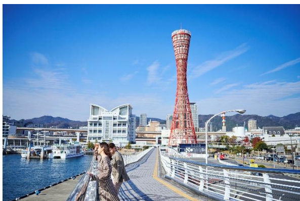
神戸メリケンパークオリエンタルホテル周辺（北側）イメージ