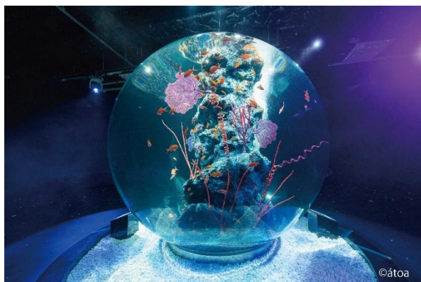
AQUARIUM×ART átoa 球体水槽「AQUA TERRA」

本プランは、átoaでの花束のサプライズ付きの入場券と、港町・神戸の絶景を望む客室で味わうシェフ特製ルームサービスを組み合わせ、記念日にふさわしい特別な一日をご提案します。映画のワンシーンに迷い込んだかのようなátoaでの没入体験と、270度を海に囲まれた当ホテルならではのロケーション。その両方を満喫できる本プランで、大切な方との思い出に残るひとときをお過ごしください。