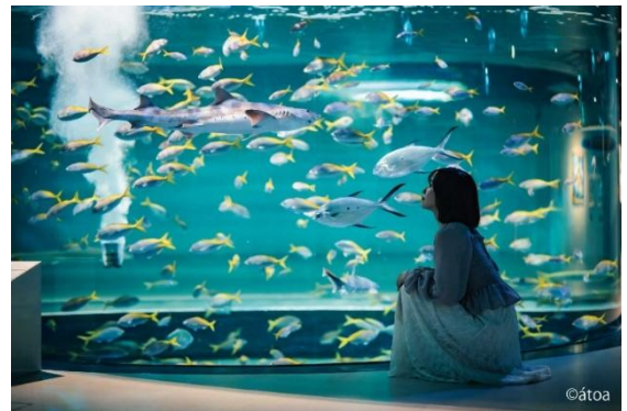
AQUARIUM×ART átoa 館内イメージ