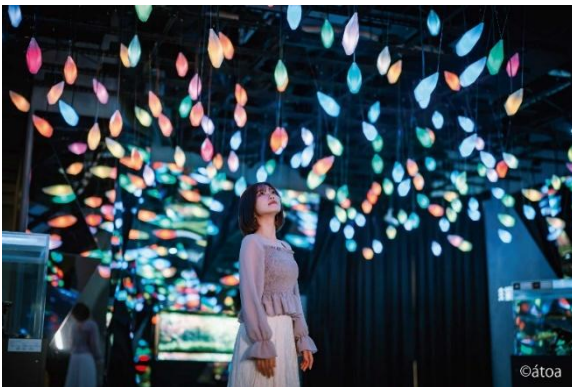
AQUARIUM×ART átoa 館内イメージ