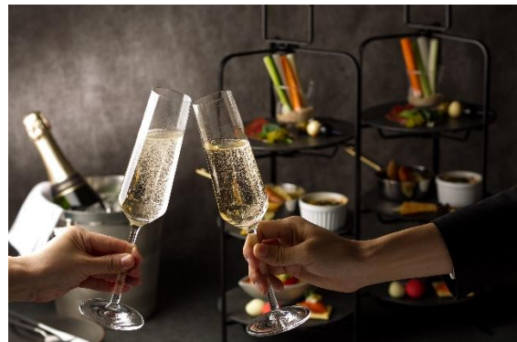
アニバーサリールームサービス イメージ