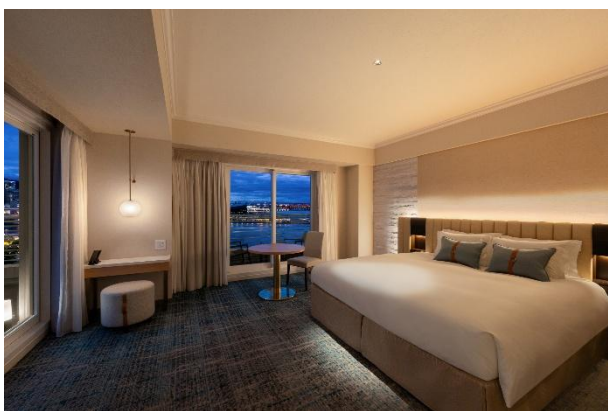
コンフォートコーナーキングルーム