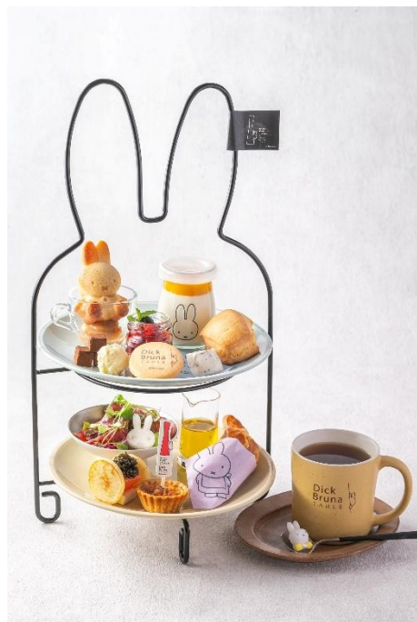
“GOOD NIGHT MIFFY”アフタヌーンティーセット

神戸メリケンパークオリエンタルホテル（兵庫県神戸市中央区）は、2026年7月30日（木）～9月30日（水）に神戸ウォーターフロントエリアで開催されるサマーイベント「KOBE PORT TOWER × Dick Bruna TABLE in KOBE Waterfront」に参画いたします。