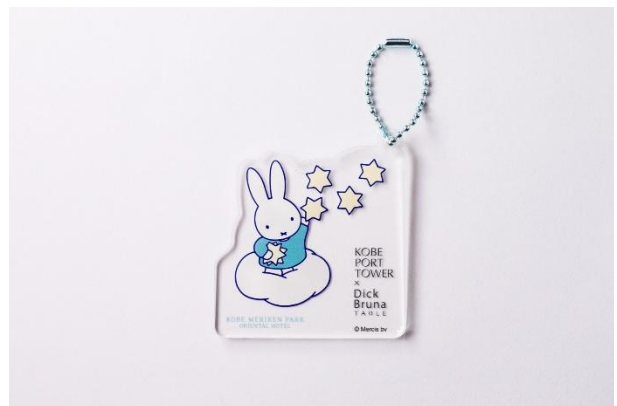
連泊プラン限定オリジナルキーホルダー (画像はイメージです)