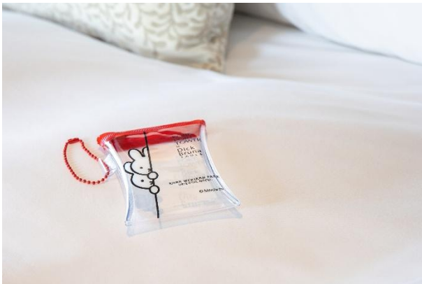
宿泊プラン限定オリジナルポーチ (画像はイメージです)

1泊の際の限定グッズは、“KOBE PORT TOWER × Dick Bruna TABLE × 神戸メリケンパークオリエンタルホテル”のコラボレーションによるオリジナルデザインのミニポーチ。カードやリップなどの小物を収納するのにぴったりなサイズ感です。ポーチには、ミッフィーたちが、ひょっこりと顔を覗かせるデザインがあしらわれています。目の前に神戸ポートタワーを望む客室バルコニーから、タワーを背景にポーチをかざせば、神戸滞在の思い出を彩るフォトジェニックな一枚を撮影いただけます。さらに、連泊プランをご利用のお客様には、「ナイトタイム」をイメージした星とミッフィーのデザインの亚克力キーホルダーがついてきます。ミッフィーのお洋服には当ホテルのロゴカラーを使用しています。また、両プランとも、イベント期間中だけのミッフィーコラボ特別仕様となる神戸ポートタワーの入場券がセットになっており、神戸のランドマークとともに、ミッフィーの世界観を存分に満喫していただける内容です。