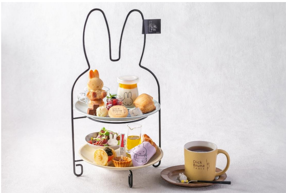
“GOOD NIGHT MIFFY” アフタヌーンティーセット