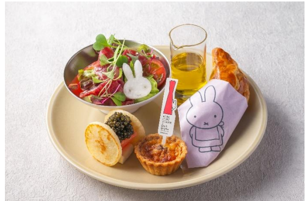
アフタヌーンティーセット 下段

上段には、まろやかなミルクジャムの上に座るミッフィーの形のフィナンシェを飾りました。さらに、ミッフィーの愛らしい表情に心がほどける瓶入りの「ブランマンジェ」、自家製レーズンバターのコクがやさしく広がる「スコーン」などをご提供いたします。