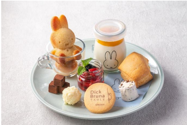
アフタヌーンティーセット 上段

カフェ「VIEW CAFE」にて、ミッフィーの世界観をシェフがイメージしたアフタヌーンティーセットを1日10食限定で販売いたします。やさしく夜へと移ろう静かな時間を表現したメニューは、セイボリーとスイーツ全10品です。Dick Bruna TABLE で使用されているものと同じ、ミッフィーの耳をモチーフしたケーキスタンドで提供いたします。