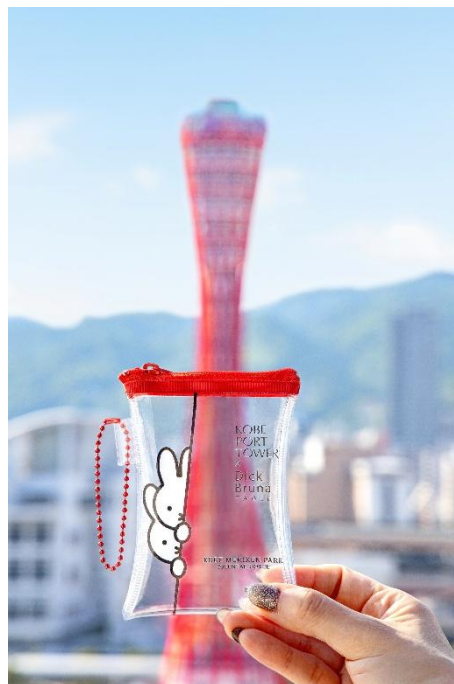
宿泊プラン限定オリジナルポーチ