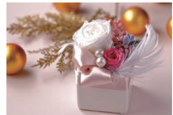
プリザーブドフラワーのアレンジメント