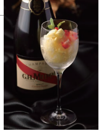
ドリミネーションカクテル 2017

■ご予約・お問合せ：ニューヨークカフェ TEL. 082-240-5567(直)