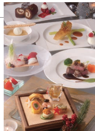
ムーングロー クリスマスディナー