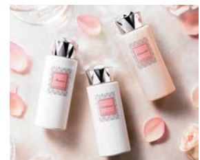
ジル・スチュアートバスタイムセット

■特 典：ジル・スチュアートバスタイムセットとプリザーブドフラワー(1室1セット)