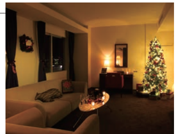
スイートルームイメージ

■特 典：ジル・スチュアートバスタイムセットとプリザーブドフラワー(1室1セット)