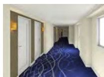
▲フロア廊下 水の都大阪をイメージ