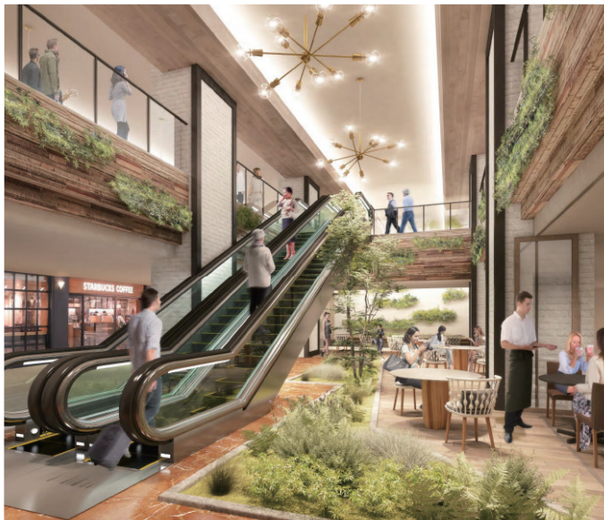
地下レストランフロアイメージ

「Eat Locally」をコンセプトに地域の旬の食と文化をダイレクトに体験することができる朝食を提供します。地元の農園、養鶏場、牧場、パン屋、珈琲店等と提携し、一つ一つの食材にこだわった地産地消のメニューをお楽しみいただけます。JR九州の豪華クルーズトレイン「ななつ星」でも採用された「伊都物語のヨーグルト」や指でつまめるほどの新鮮な卵「つまんでご卵」、地元糸島の契約農家で育まれた採れたて野菜など九州を代表する食材を堪能できます。夜は、地元で醸造されたオリジナルクラフトビールやヴァンナチュール（自然派ワイン）を提供し、多様な人々が賑わうコミュニティ空間を演出します。その他、地下レストランフロアでは、福岡エリアで初出店となる新業態の店舗など様々な飲食店を揃え、「食の都ふくおか」を堪能することができます。