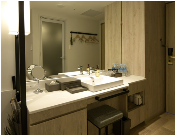
広々ご利用いただける外付けの洗面台スペース