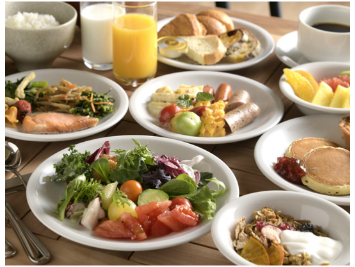
糸島野菜など福岡の魅力が詰まった朝食