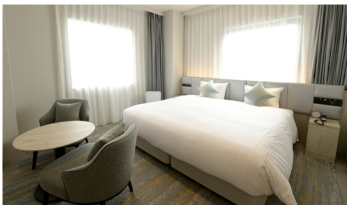
デラックスダブルルーム

「Natural × Cool」をデザインコンセプトにした客室は全221室。明るく爽やかでナチュラルな素材感を随所にあしらい、心地よい上質さを感じるお部屋です。また、全室洗面台をバスルームの外に配置し、広々とした浴室はくつろぎの空間となっています。さらに宿泊者だけが利用できる24時間利用可能な最新鋭のマシンを備えた「ジム」をはじめ、安らぎの時間を過ごすことのできる「エグゼクティブガーデン」を新設、快適でゆとりあるご滞在にご利用ください。爽やかな朝には「Eat Locally」をコンセプトにした地域の旬の食と文化をダイレクトに体験することができる朝食を提供します。地元の農園、養鶏場、牧場、パン屋、珈琲店等と提携し、一つ一つの食材にこだわった地産地消のメニューをお楽しみいただけます。