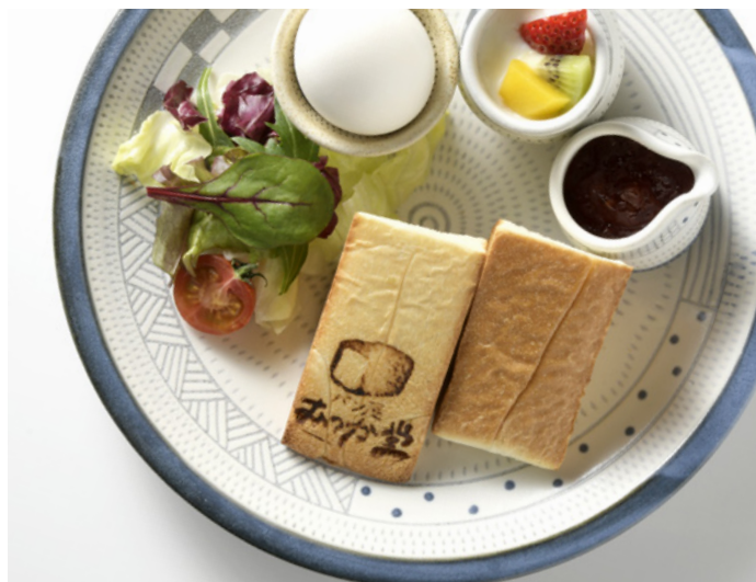
むつか堂食パンを使った軽食プレート