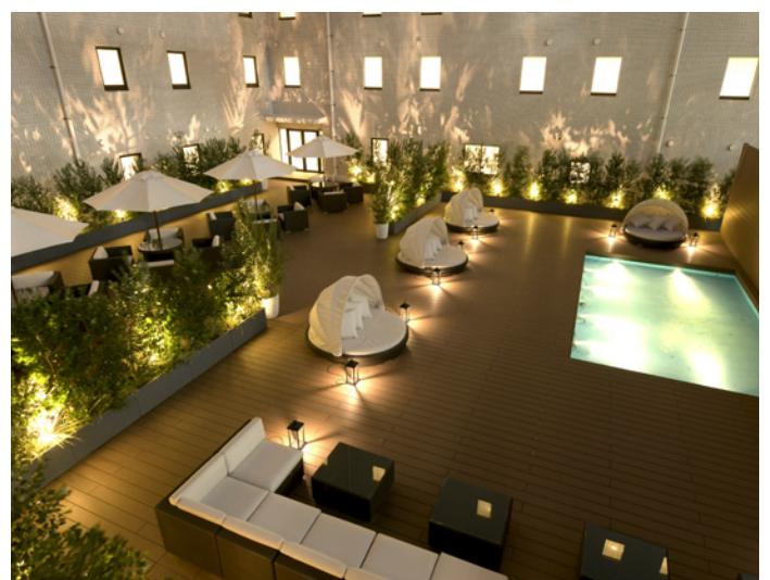
エグゼクティブガーデン

抜群の立地に加え、全13室の多彩な会議・宴会場がお客様の多様なニーズにお応えします。自然のぬくもりを感じられる、明るく清潔感のある空間は、パーティから会議まで、さまざまなシーンで多目的にご利用いただけます。2FのLibraryでは、体験型のイベントを定期的で開催。陶芸体験をはじめ、紙漉き和紙体験や抹茶体験に書道体験などインバウンドのお客様にも日本の文化を実際に体感いただけます。