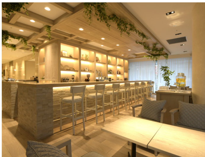
Cafe&Bar CROSS POINT

2Fのカフェ&バー「Cross Point」では、オリエンタルホテル福岡オリジナルコーヒーをフレンチプレス抽出でお楽しみいただけるほか、筑前小石原焼窯元“森喜窯”の器でご提供する“むつか堂”の食パンのサンドイッチ、SHIKAHACHIのハニートーストなど福岡にこだわったメニューをお届けいたします。その他、地下レストランフロアでは、福岡エリアで初出店となる新業態の店舗など全8店舗の飲食店を揃え、「食の都ふくおか」を堪能することができます。