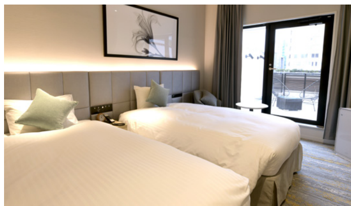
バルコニーツインルーム