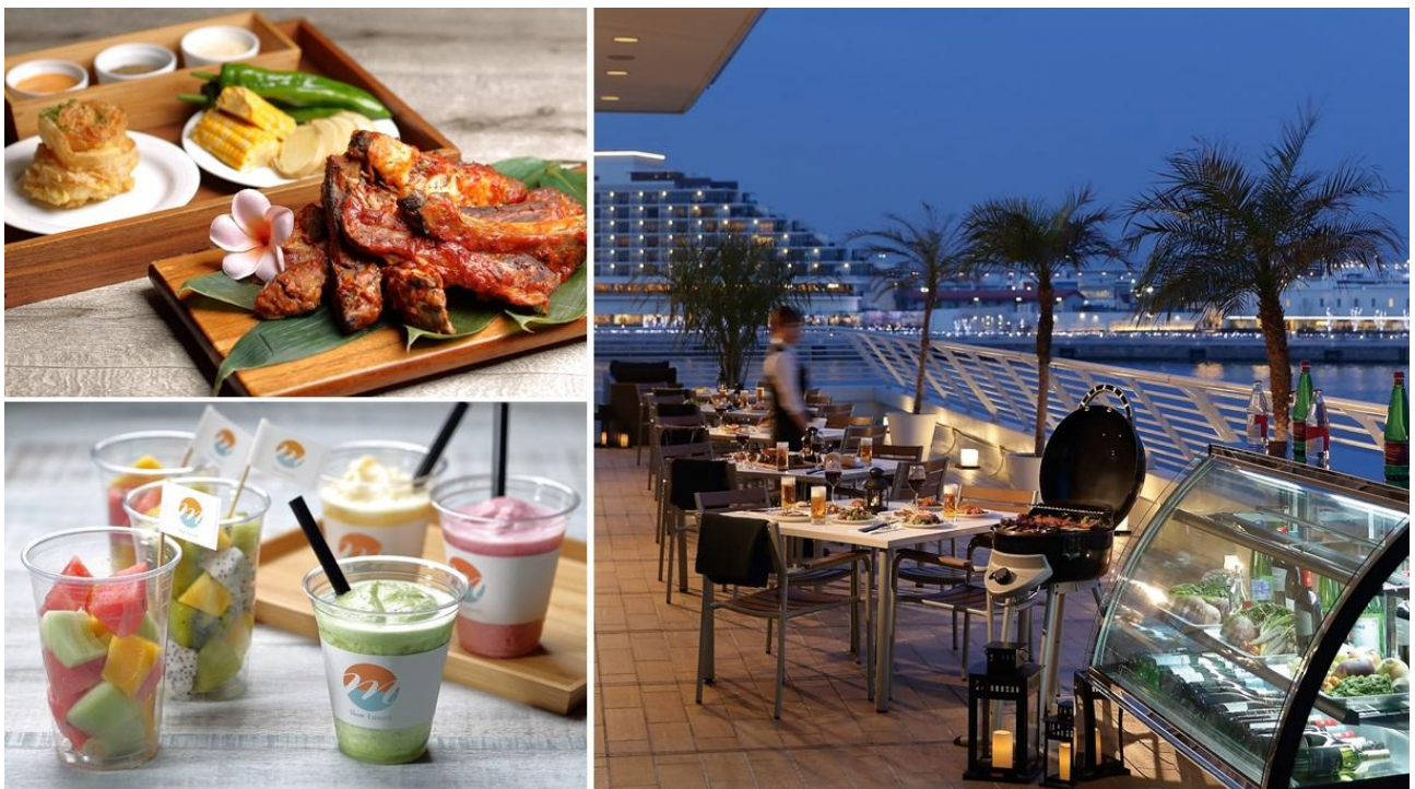
<左上：BBQセットのイメージ、左下：スムージーとカットフルーツのイメージ、右：ビアテラスのイメージ>

また、オプションにて炭火のグリルでスペアリブを香ばしく焼き上げ3種類のソースにつけてお召し上がりいただけるビアテラス限定メニューのBBQセットや、フルーツや野菜を使ったカラフルなスムージーが初登場いたします。トマトやバナナ、メロン、レモンなどを組み合わせ「レッド」「イエロー」「グリーン」の3種類のスムージーをご用意いたします。