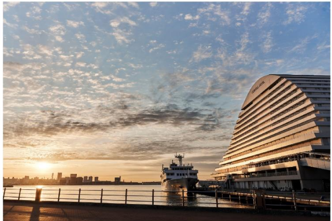
神戸メリケンパークオリエンタルホテル