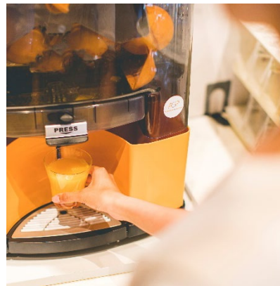
フレッシュオレンジジュース