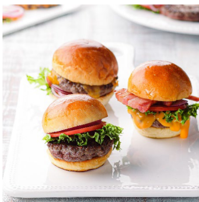
肉厚ビーフバーガー