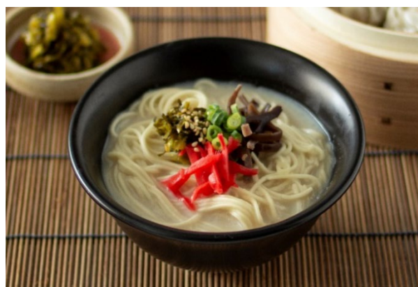
博多とんこつラーメン

福岡県の各地域でつくられている定番の郷土料理です。炊いたご飯に、かしわや福岡県産の具材を混ぜ合わせました。県産ブランド米の元気づくしと噛めば噛むほどに旨味のある鶏肉をご堪能ください。