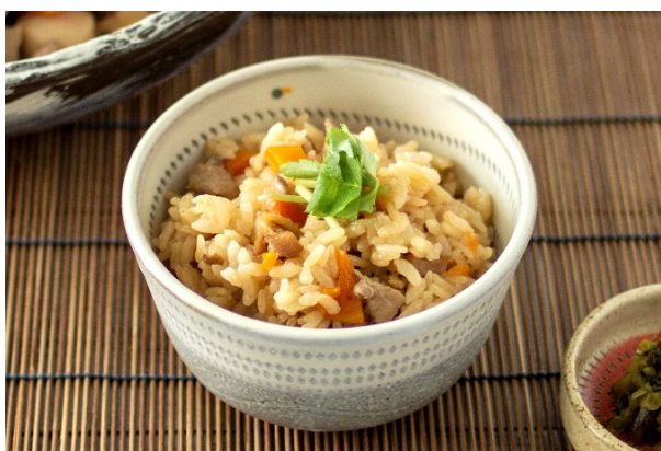
博多名物 かしわめし

福岡県の各地域でつくられている定番の郷土料理です。炊いたご飯に、かしわや福岡県産の具材を混ぜ合わせました。県産ブランド米の元気づくしと噛めば噛むほどに旨味のある鶏肉をご堪能ください。