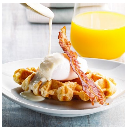
クロッフルベネディクト