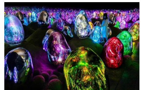
チームラボ《呼応する小宇宙の苔庭 - 固形化された光の色、Sunrise and Sunset》©チームラボ