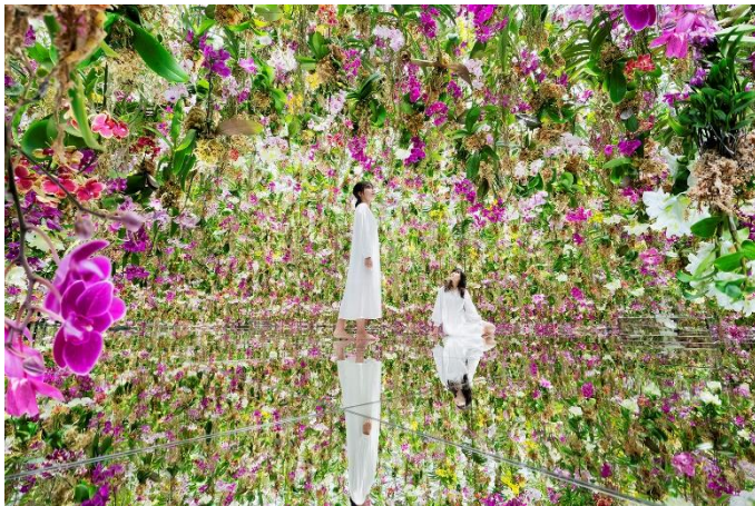
チームラボ《Floating Flower Garden; 花と我と同根、庭と我と一体》©チームラボ

【2023 年 3 月 3 日】ヒルトン東京お台場(東京都港区台場)では、東京・豊洲にある「チームラボプラネッツ」のチケットが付いた宿泊プランを 2023 年 3 月 3 日(金)より通年で販売開始いたします。