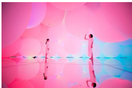
チームラボ《意思を持ち変容する空間、広がる立体的存在 - 平面化する 3 色と曖昧な 9 色、自由浮遊》©チームラボ

臨海副都心エリアで話題のスポットが体験できる特別な宿泊プランを、この機会にぜひお楽しみください。