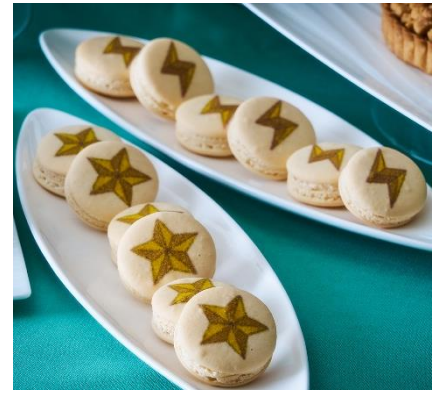
ステラマカロン・トニトマカロン