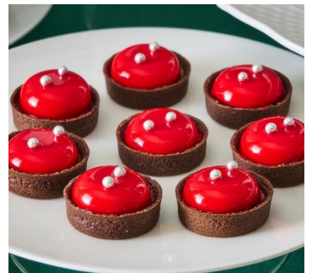
【ヨル】林檎のケーキ