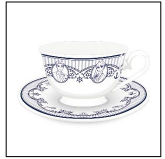
カップ&ソーサー 4,000 円(税込 4,400 円)