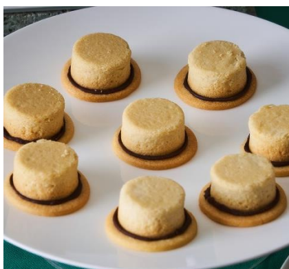
【黄昏】帽子仕立てのケーキ