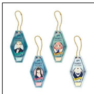
アクリルキーホルダー(ランダム4種) 700 円(税込 770 円)