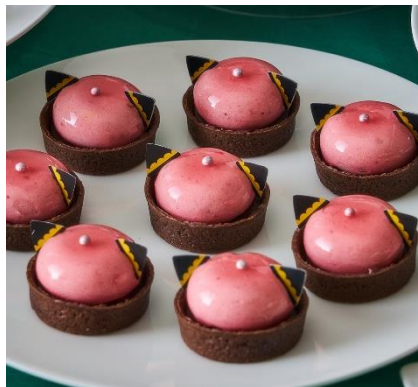
【アーニャ】イチゴのムース