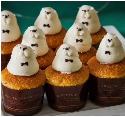
【ボンド】カップケーキ