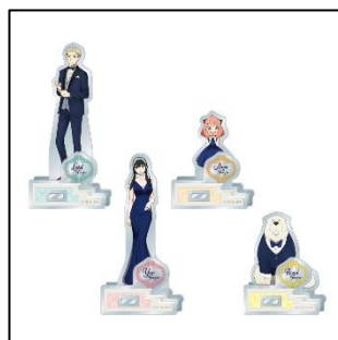
アクリルスタンド(全4種) 各 1,200 円(税込 1,320 円)