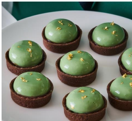
【ロイド】ピスタチオのムース