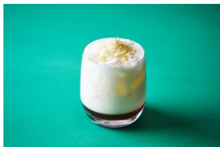
White Milky Mocktail ~ボンド~ 1,500 円 チョコレートソース、ポップコーンシロップ、牛乳、 ホイップクリーム、ホワイトチョコレート