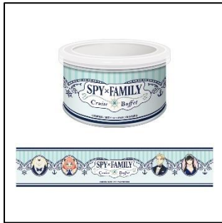
缶入りラスク 1,650 円(税込 1,815 円) ※店舗限定