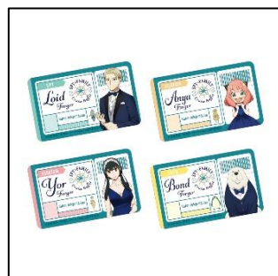
ステッカー(ランダム4種) 500 円(税込 550 円)