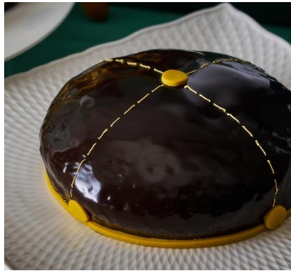
イーデン校のバレー帽ケーキ