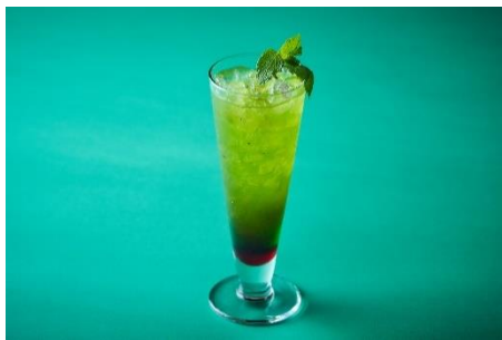
Twilight Kiwi Mocktail ~ロイド~ 1,500 円 グレンデンスシロップ、キウイシロップ グレープフルーツジュース、ラムシロップ、炭酸 アラザン、ミント