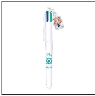
チャーム付き 4色ボールペン 1,000 円(税込 1,100 円)