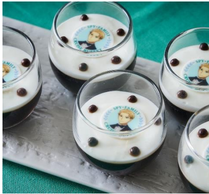
【ロイド】コーヒーゼリーミルクソース入り