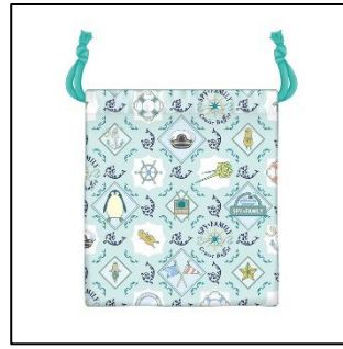
巾着 1,200 円(税込 1,320 円)