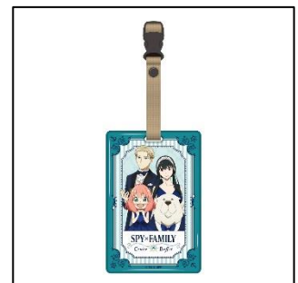
ラゲッジタグ 1,500 円(税込 1,650 円)