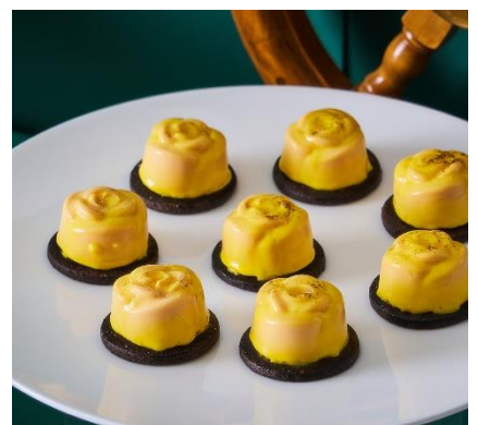
【いばら姫】バラのムース