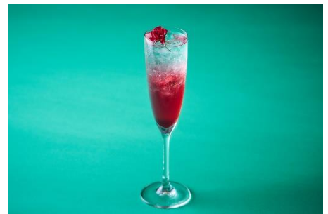
Elegant Rose Mocktail ~ヨル~ 1,500 円 ローズ、グレンデン、クランベリージュース トニックウォーター、ベルローズ