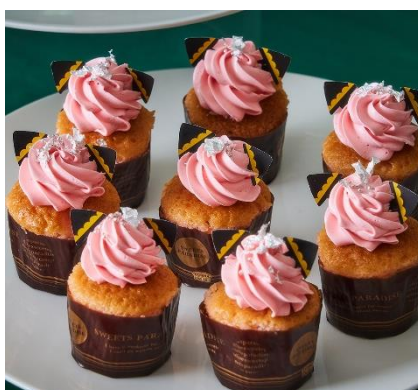
【アーニャ】キラキラカップケーキ