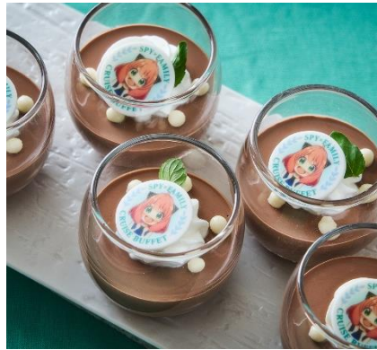
【アーニャ】ココアバナナコッタ