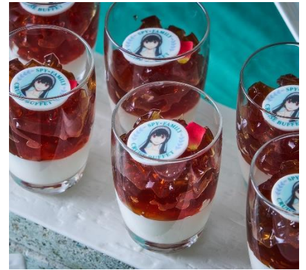
【ヨル】紅茶のジュレ