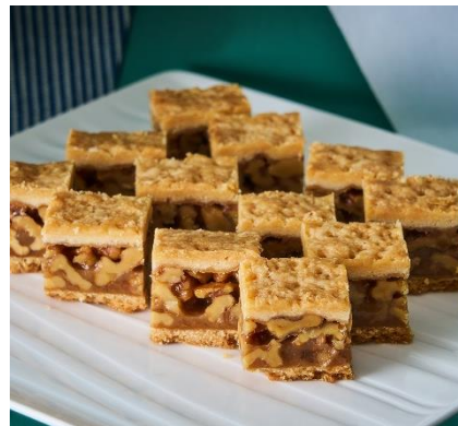
キャラメルナッツのケーキ(エンガーディナー)