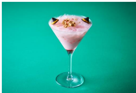
Sweet Strawberry Mocktail ~アーニャ~ 1,500 円 いちごシロップ、ライチシロップ、飲むヨーグルト パイナップルジュース、クラッシュ/ピーナッツ、 チョコレート