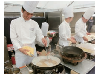
過去の出店の様子