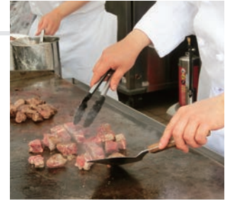
過去の出店の様子

オリジナルカレーや毎年人気のサイコロステーキ、サフランライスの上に鴨のフォアグラを盛りつけた「総料理長こだわりのフォアグラ丼」といった、ホテルならではのメニューを、出来立てで提供。また、マンゴーの果汁で作った氷を削り、果肉をトッピングした「マンゴーのふわふわかき氷」が初登場します。ほか、ドリンクも豊富に取り揃えました。「ひろしまフラワーフェスティバル」にお越しの際は、ぜひ「オリエンタル広場」にお立ち寄りいただき、青空の下でホテルグルメをお愉しみください。