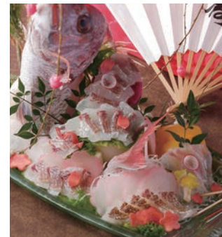
鯛の姿造り イメージ