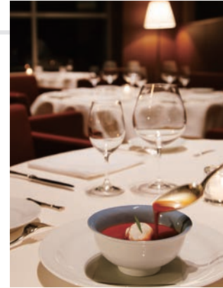
ディナー イメージ