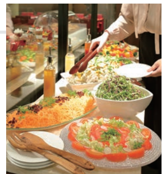
サラダバー イメージ

■ご予約・お問合せ: ニューヨークカフェ TEL. 082-240-5567(直)