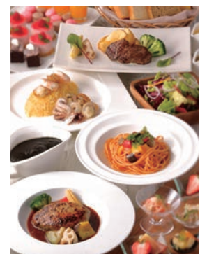
POWERD LUNCH イメージ