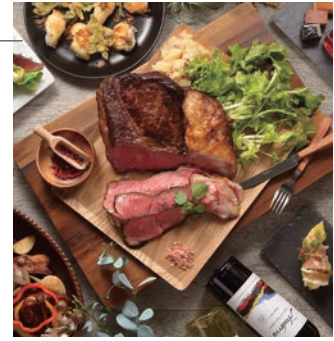
春のワインディナーbuffet イメージ

■ご予約・お問合せ：ニューヨークカフェ TEL. 082-240-5567(直)