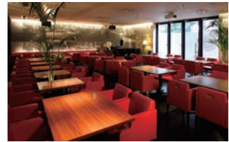
ニューヨークカフェ 店内