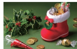
お子様へのプレゼント イメージ