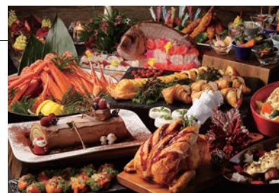
ムーングロー クリスマスディナーbuffet

クリスマス・イブの1夜だけ、夜景きらめくホテル最上階のバンケットに、ご家族や大切な方と楽しく過ごす聖夜のためのクリスマスbuffetが登場。ツリーが映える白の空間には、色鮮やかな料理がずらりと並びます。大きなチーズの器の中で作るカルボナーラや、目の前でシェフが炙る国産牛ロース肉のスペシャルメニューはもちろん、お子様が大好きなハンバーグや海老フライもご用意。お子様には、ホテルから真っ赤なサンタブーツ入りのお菓子をプレゼント。