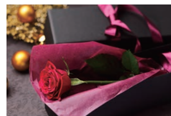
1輪の赤い薔薇(専用BOX入り)