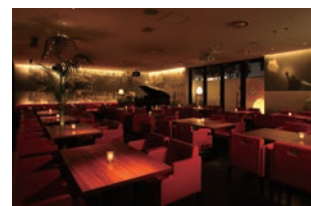
ニューヨークカフェ店内