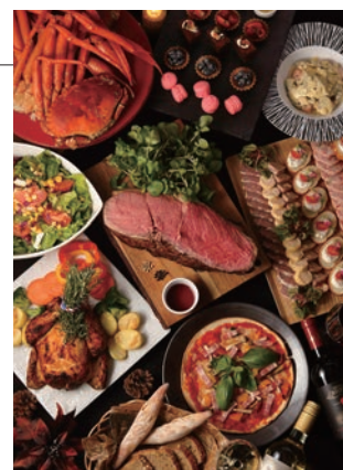
クリスマスディナーbuffet 料理イメージ

■ご予約・お問合せ：ニューヨークカフェ TEL. 082-240-5567(直)