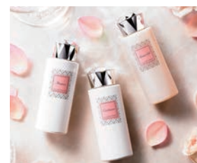
ジル・スチュアートバスタイムセット