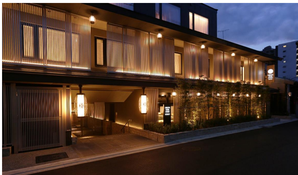
*「エントランス」のイメージ

ホテル運営会社である株式会社ホテルマネジメントジャパン（本社 東京都渋谷区/代表取締役：東 俊三）は、2019年11月1日 京都で2軒目のオリエンタルホテルとなる「オリエンタルホテル京都 六条」を開業いたします。「The Essence of Nippon」をコンセプトに日本の本質的価値を探究し、禅と茶庭をテーマに地域性を活かした価値体験を提供するサービスを展開いたします。本質的価値を追求するためのデザインとして、日本の古来からある灯りのイメージを取り入れています。