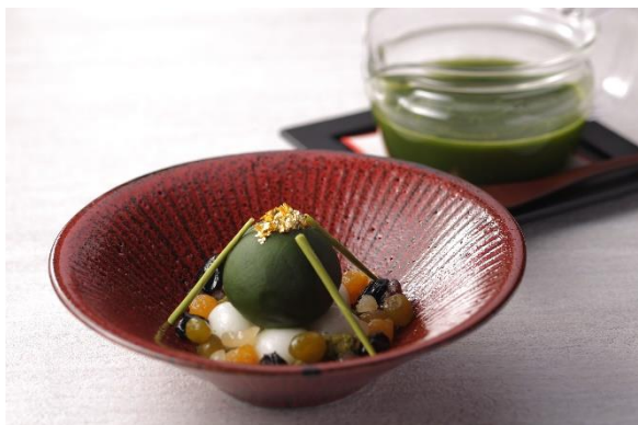
<オリジナル抹茶ぜんざい>のイメージ

夕方からは、一般のお客様も利用可能なラウンジ&バーとして営業します。地域らしさを取り入れ旅の記憶に残る味をお酒と甘味のハーモニーでご提供いたします。本物志向の京都の文化人に愛されている「伊藤柳櫻園茶舗」の抹茶や、茶庭の苔玉に見立てた抹茶餡に露地の飛び石のような色とりどりの京かこの豆などを組み合わせた抹茶ぜんざいなどオリジナルの和スイーツのご用意もございます。また、抹茶のカクテル、京都を代表する佐々木酒造の日本酒やウィスキーと和スイーツのペアリングを楽しんでいただけます。