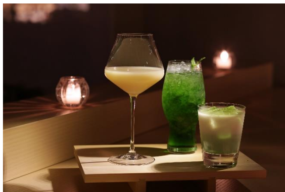
<カクテル>のイメージ