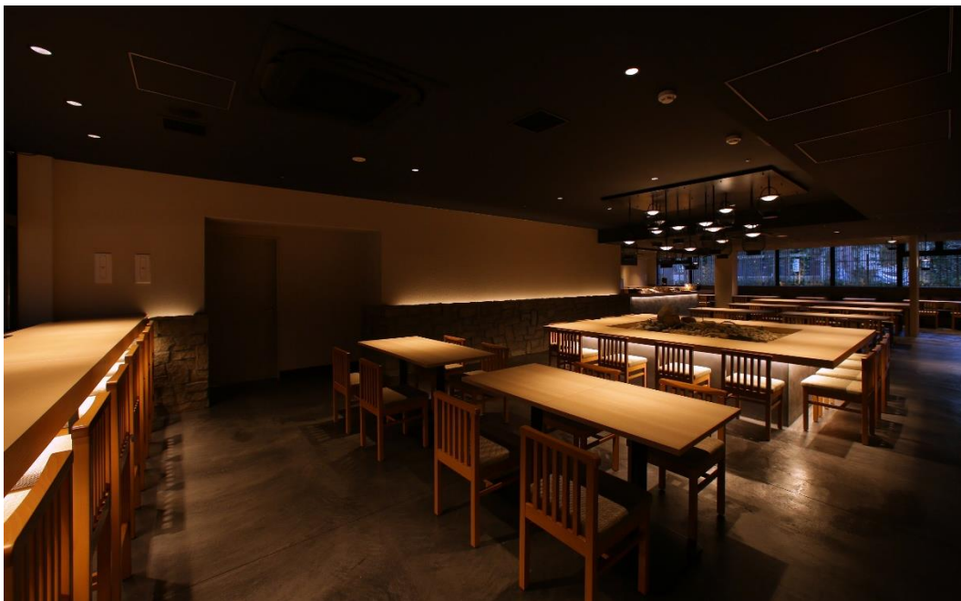
*レストラン 「穩坐 - ONZA - (おんざ)」のイメージ