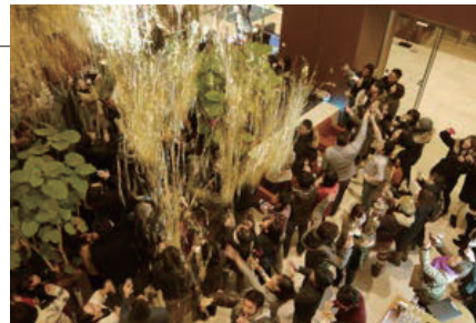
カウントダウンイベントの様子