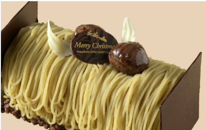
③ 和栗モンブランのクリスマスノエル