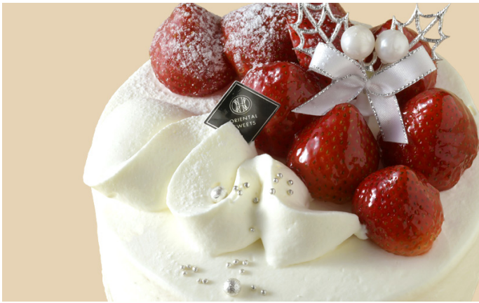
① あまおう苺のクリスマスケーキ