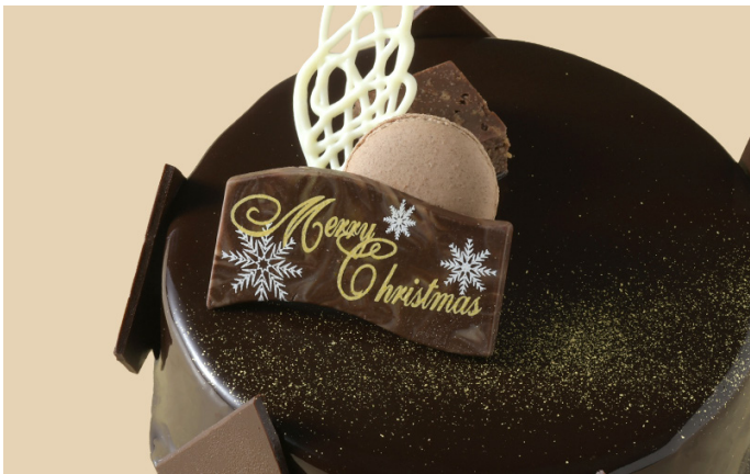
② クリスマスショコラ