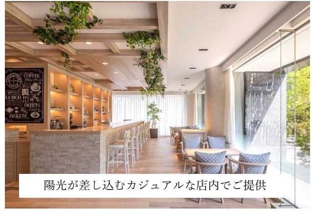
陽光が差し込むカジュアルな店内でご提供