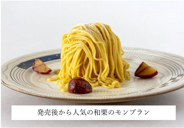
発売後から人気の和栗のモンブラン