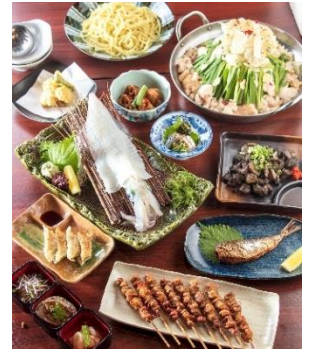
※竹乃屋コースイメージ