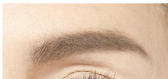
<仕上がりイメージ>