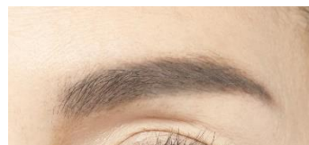
<仕上がりイメージ>