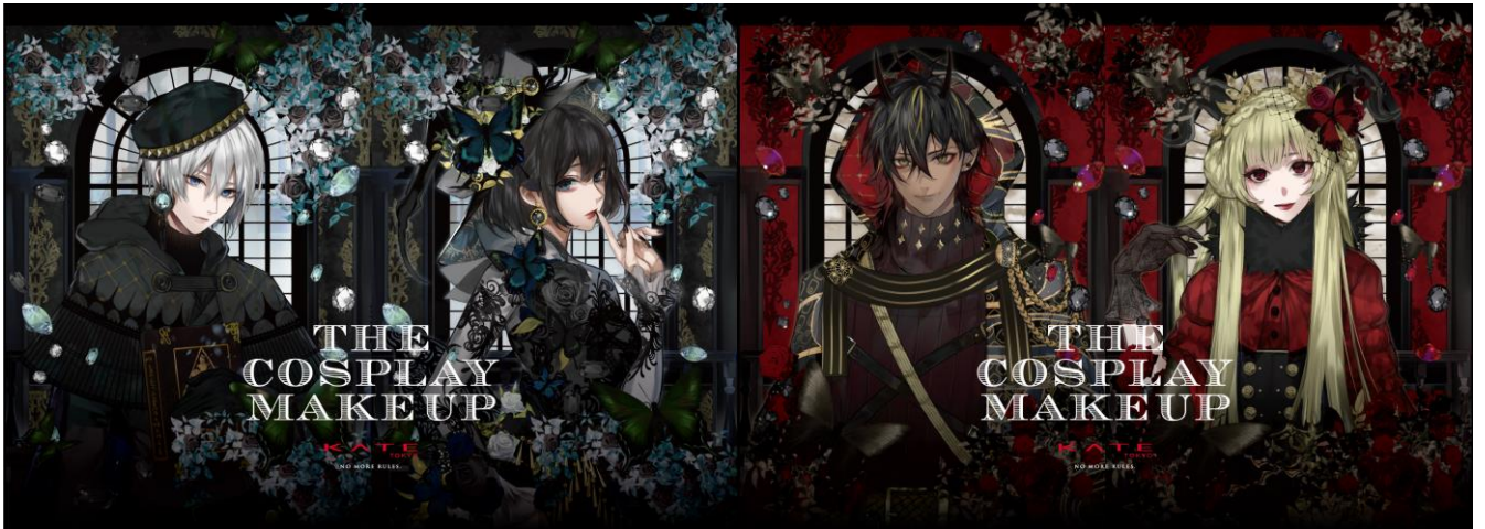
Black Spinel -ブラックスピネル-