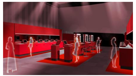
※東京会場内観イメージ