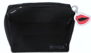
唇チャーム付きオリジナルポーチ