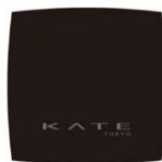
オリジナルコンパクトミラー