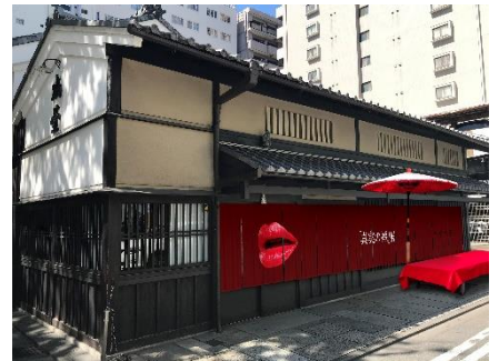
※京都会場外観イメージ