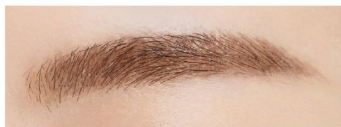
(仕上がりイメージ)