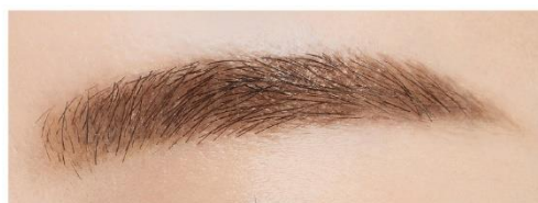
(仕上がりイメージ)