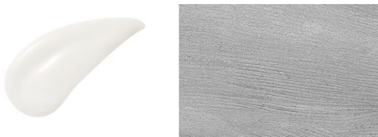
「オン スキン エッセンス V」に採用している 処方塗膜によって形成される“層構造保湿ヴェール”のイメージ画像

肌に塗布した瞬間すぐに層構造の保湿ヴェールを形成し、うるおいで満たし閉じ込める。美しい肌がそうであるように、表面だけでなくヴェール内でも光が散乱し、ふんわり明るい肌印象へ。