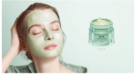
とろける、ひたる、3分間 とろとろマスク洗顔