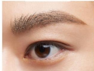
仕上がりイメージ (EX-2)