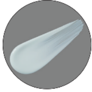
トーンアップ効果のある ブルーのリキッド