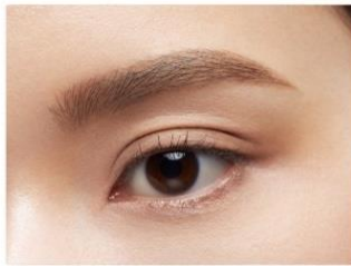
仕上がりイメージ (EX-1)