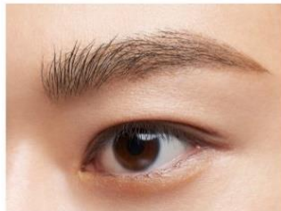
仕上がりイメージ (EX-1)