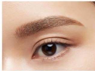
仕上がりイメージ (EX-2)