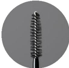
ほどよい束感を出せる スクリューブラシ