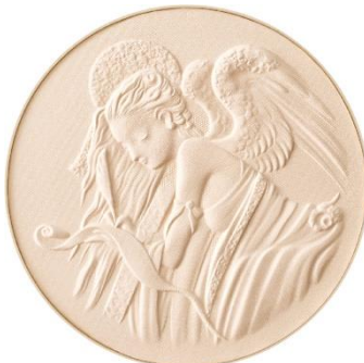
パウダー表面には精巧な“ミラコレ天使”のレリーフ