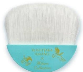
コラボ記念オリジナルフェースブラシ