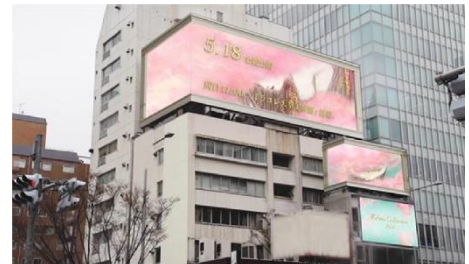
屋外ビジョンイメージ