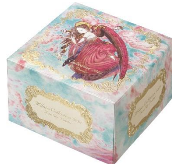
天野氏原画の世界観を存分に堪能できる商品箱