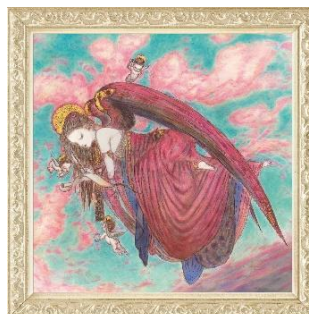
天野喜孝氏描き下ろしの原画