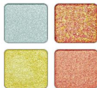
EX-3 トロピカルサニービーチ