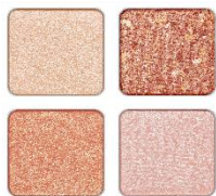
EX-1 ピンキーサンライズ