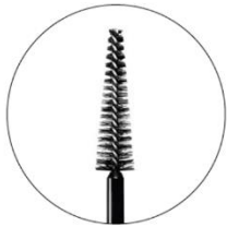
前髪を立ち上げやすい 大きめの専用ブラシ