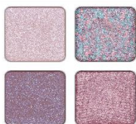
EX-2 スターリーナイトオーシャン