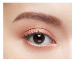
レッドブラウン系 × ストロベリーレッド