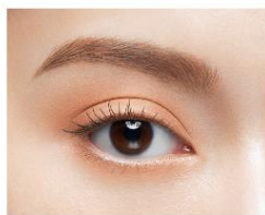
ライトブラウン系 × キャロットオレンジ