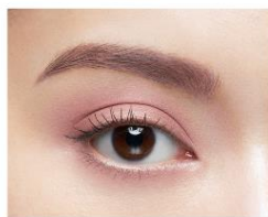
ブラウン系 × ライラックパープル