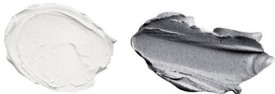
2 種のクレイのイメージ