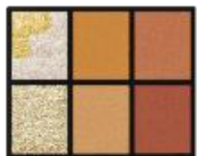
【夢幻ミュージアム】 EX-2