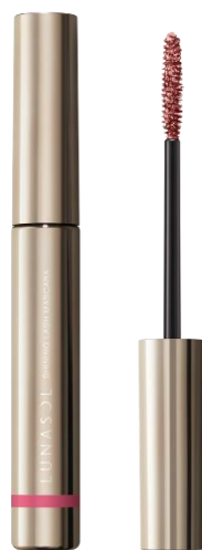
EX01 Glisten Berry