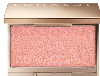
EX08 Dream Lover