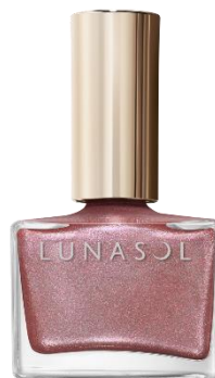
EX39 Plum Fizz