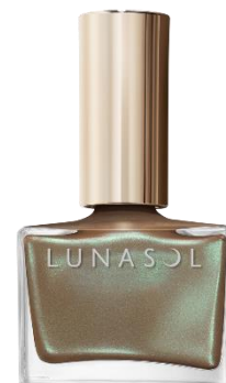
EX40 Beyond Stream