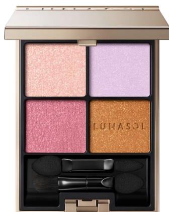
21 Melting Nebula