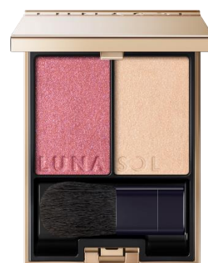
EX09 Harmony Cloud