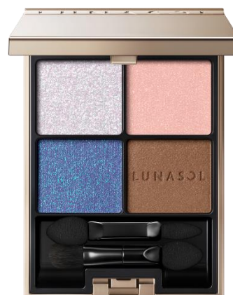
EX33 Galaxy Loop