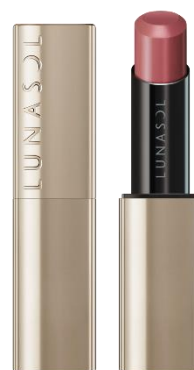
EX12 Fuchsia Pop