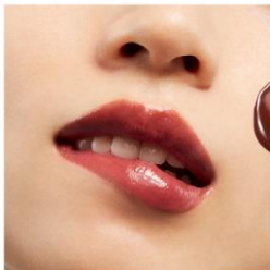
V07 Inmost Desire