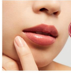
V02 Classical Red

ゴールドの輝きを纏うやわらかなピンクが、 優美な表情にみせるキューピッドストーン