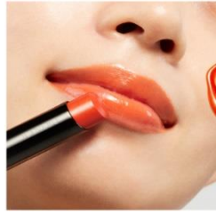
EX1 Delight Orange 限定