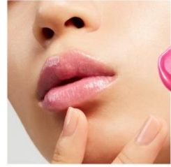
EX2 Sweet Up 限定