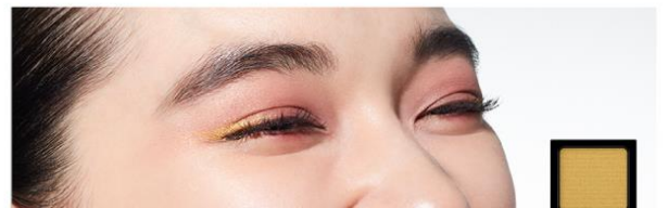
23 Tropical Passion

熱帯の風に揺れる睡蓮のように繊細さとともに 情緒溢れる表情にみせるエモーショナルカラー