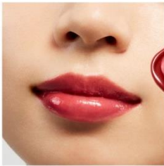
V04 Core Red