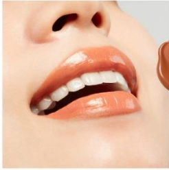
V10 Golden Amber