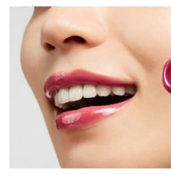
V03 Rapture Rose