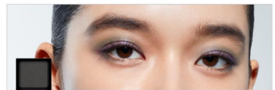
EX10 Offbeat Flower 限定

ジャスミンの花を纏うようにやわらかく優美な表情を 目もとに宿すニュアンスライトカラー