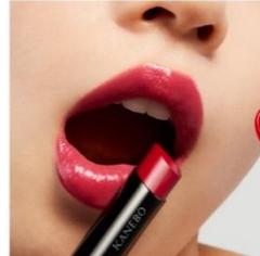
V05 Vivid Passion