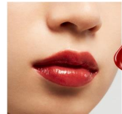
V06 Heat Red