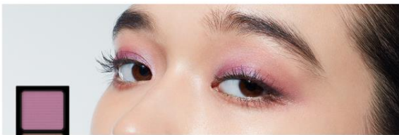
22 Lotus Breeze

熱帯の風に揺れる睡蓮のように繊細さとともに 情緒溢れる表情にみせるエモーショナルカラー