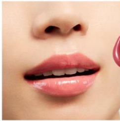
V01 Cupid Stone

ゴールドの輝きを纏うやわらかなピンクが、 優美な表情にみせるキューピッドストーン