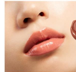
V09 Innocent Mood

自然な血色感をもたらす温もりを感じる色で、 唇から美しさが咲き誇るピーチブルーム