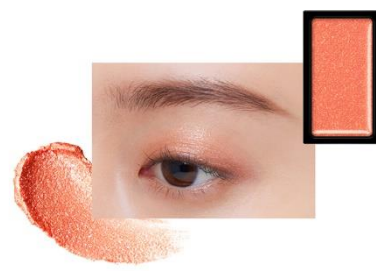
EX3 Sunshine Ruby 〈限定〉

フューシャピンクにアクセントのブルーパールがプリズムのように煌めくプリズムパワー