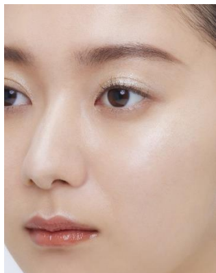
ハイライトとしてフェースに。 (使用色：EX5)

いつものアイシャドウの上に重ねたり、ハイライト、チークなどにも使える、マルチユースタイプ。