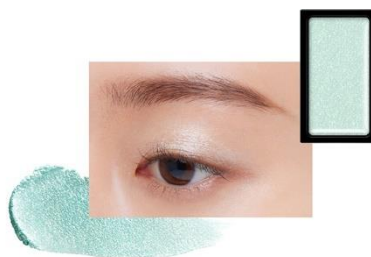
EX5 Summer Sorbet 〈限定〉

みずみずしいフルーツのようなイエローグリーンがフレッシュに煌めくマスカットフラッシュ