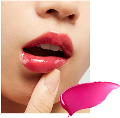
EX3 Cranberry Drop 〈限定〉

デューイーな質感に鮮やかな血色感を潜ませ、唇の弾力まで感じさせる色・質感。 フレッシュな透明感を演出する限定カラー。