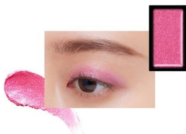
EX2 Prism Power 〈限定〉

フューシャピンクにアクセントのブルーパールがプリズムのように煌めくプリズムパワー