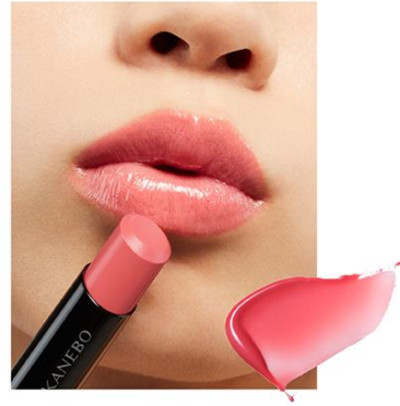
EX4 Guava Punch 〈限定〉

熟れた果実のようなジューシーで 鮮やかなピンキッシュレッド。 ヘルシーな血色感で肌を美しくみせる クランベリードロップ