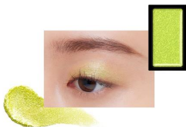
EX4 Muscat Flash 〈限定〉

日差し眩しさにじむようなトロピカルコーラルにピンクやゴールドのパールが煌めくサンシャインルビー