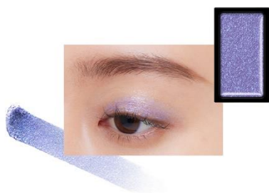
EX1 Night Pool 〈限定〉