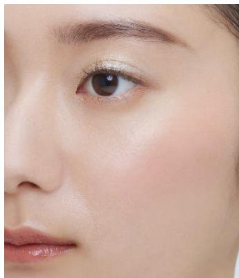
チークカラーとして。 (使用色：EX3)