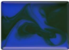
EX-1 異時空 MAP