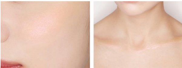
仕上がりイメージ (EX-1)