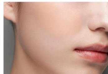
すべて仕上がりイメージ

水あめのようにとろけるバームが ピタッと密着。 近未来的 肉厚ちゅるんツヤ感リップバーム。