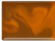
EX-2 未来 DIARY