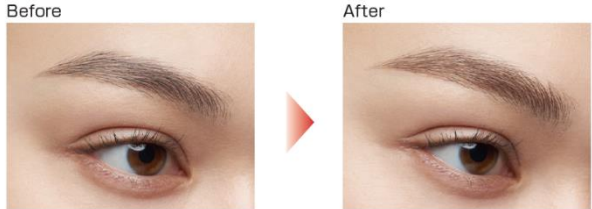
仕上がりイメージ(BR-1)