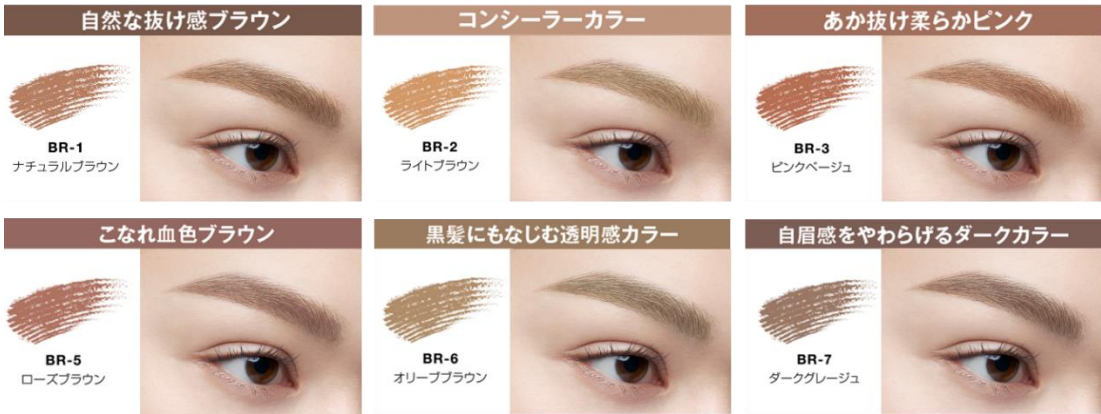
すべて仕上がりイメージ