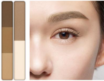
EX-4 ライトブラウン系×ウォームコントウア