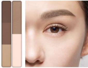
EX-5 ブラウン系×クールコントウア