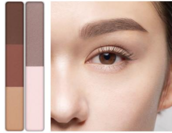
EX-8 ブラウンピンク系×透明感コントウア